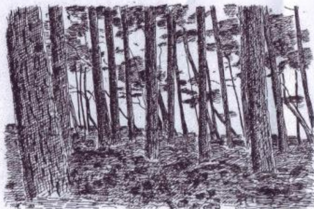
Østrigske fyr ved stranden

Naturskovparcellerne har stået urørt i mange år. Her har fuglene kronede dage, fordi træerne får lov at blive gamle og dø på roden. Det giver et rigt larve- og insektiv i de rådne træer og dermed et vigtigt spisekammer for fuglene.