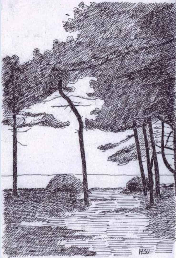
En træsamling ved Store Bælt