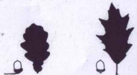
Alm. eg med lang stilk på agern.

Naturskovparcellerne har stået urørt i mange år. Her har fuglene kronede dage, fordi træerne får lov at blive gamle og dø på roden. Det giver et rigt larve- og insektiv i de rådne træer og dermed et vigtigt spisekammer for fuglene.